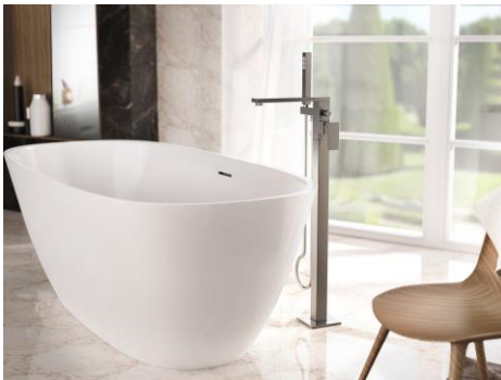
Vasca MUSA Rubinetteria INCANTO

Vasca e lavabo possono essere abbinati con tutti i modelli di rubinetteria GRAFF, in particolare con le collezioni Phase e Sade. La collezione MUSA è disponibile nella finitura bianco lucido o bianco opaco.